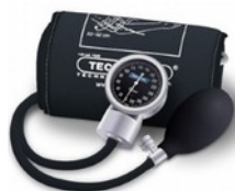
Ciśnieniomierz TM-Z zegarowy Kod: TM013 Cena: 70,00 zł brutto