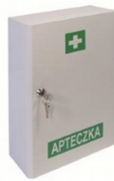
Apteczka VERA2 wyposażenie DIN 13164 PLUS Kod: 32-005 Cena: 118,00 zł brutto