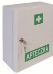
Apteczka VERA1 wyposażenie DIN 13164 PLUS Kod: 32-004 Cena: 109,00 zł brutto