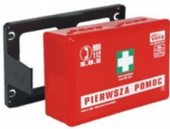
Apteczka ST wyposażenie DIN 13164 PLUS Kod: 32-001 Cena: 35,00 zł brutto