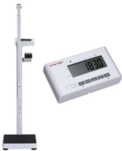
Waga medyczna elektryczna ze wzrostomierzem 2 m Kod: 34-001 Cena: 1220,00 zł brutto