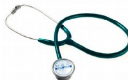
Stetoskop internisty czarny, szary, zielony Cena: 111,00 zł brutto