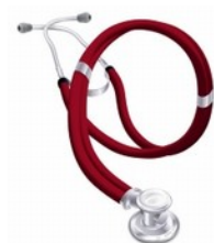
Stetoskop uniwersalny czarny, czerwony Cena: 83,00 zł brutto