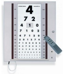
Tablica okulistyczna podświetlana z pilotem Kod: 34-012 Cena: 3130,00 zł brutto