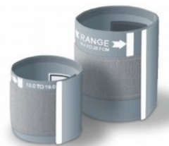
Zestaw mankietów pediatrycznych Kod: 1P - TM035 2P - TM036 Cena: 69,00 zł brutto