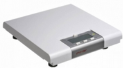
Waga medyczna elektryczna podłogowa Kod: 34-009 Cena: 740,00 zł brutto