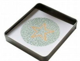
Tablice Ishihary dla dzieci -10 tablic Kod: NAT31286 Cena: 199,00 zł brutto

Zapraszamy do zapoznania się z szerszą ofertą na naszej stronie www.jtmebel.pl