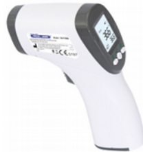
Termometr elektryczny bezdotykowy Kod: TM018 Cena: 115,00 zł brutto