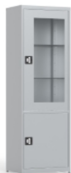
Szafa medyczna MDW1 Kod: KMMDW0618 Cena: 1090,00 zł brutto