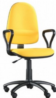
Fotel Champion Kod: B0211 Cena: 185,00 zł brutto