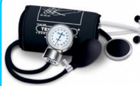
Ciśnieniomierz TM-ZS zegarowy ze stetoskopem Kod: TM010 Cena: 84,00 zł brutto