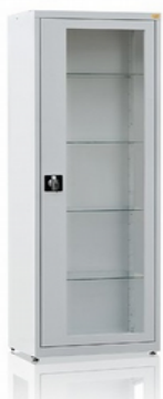
Szafa medyczna MD1 Kod: KMMD0618 Cena: 1090,00 zł brutto