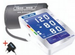
Ciśnieniomierz TMA-1000 elektryczny Kod: TM001 Cena: 158,00 zł brutto