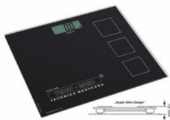
Waga ES001 elektryczna Kod: TM019 Cena: 74,00 zł brutto