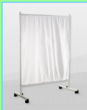
Parawan jednoskrzydłowy Kod: 33-003 Cena: 235,00 zł brutto