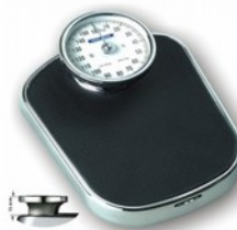
Waga mechaniczna Kod: TM023 Cena: 147,00 zł brutto