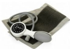
Ciśnieniomierz lekarski Kod: NATCK-112P Cena: 130,00 zł brutto