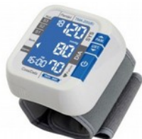
Ciśnieniomierz TMA-200 elektryczny Kod: TM004 Cena: 89,00 zł brutto