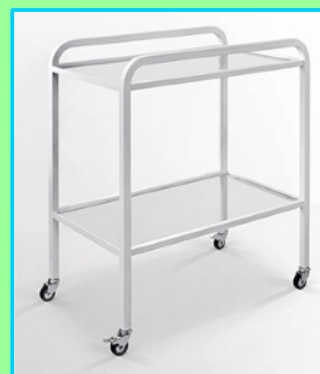
Stolik zabiegowy Kod: 33-005 Cena: 475,00 zł brutto