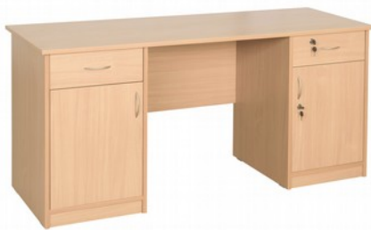
Biurko B3N – białe Kod: B3001 Cena: 480,00 zł brutto