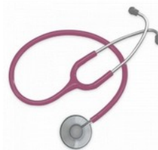
Stetoskop SPIRIT różne kolory Cena: 59,00 zł brutto

Zapraszamy do zapoznania się z szerszą ofertą na naszej stronie www.jtmebel.pl