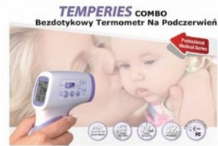
Termometr COMBO elektryczny bezdotykowy Kod: 34-011 Cena: 155,00 zł brutto