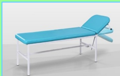
Kozetka standard Kod: 33-001 Cena: 419,00 zł brutto