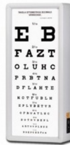
Tablica okulistyczna podświetlana – 3 m Kod: NAT27381 Cena: 1220,00 zł brutto