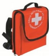
Apteczka Szkolna 1 wyposażenie DIN 13164 PLUS Kod: 32-006 Cena: 68,00 zł brutto