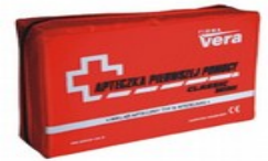
Apteczka Classic wyposażenie B-INTER Kod: 32-014 Cena: 14,00 zł brutto