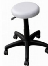
Taboret lekarski A Kod: BAK127 Cena: 150,00 zł brutto